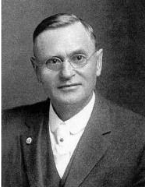
Max Heindel 1865-1919