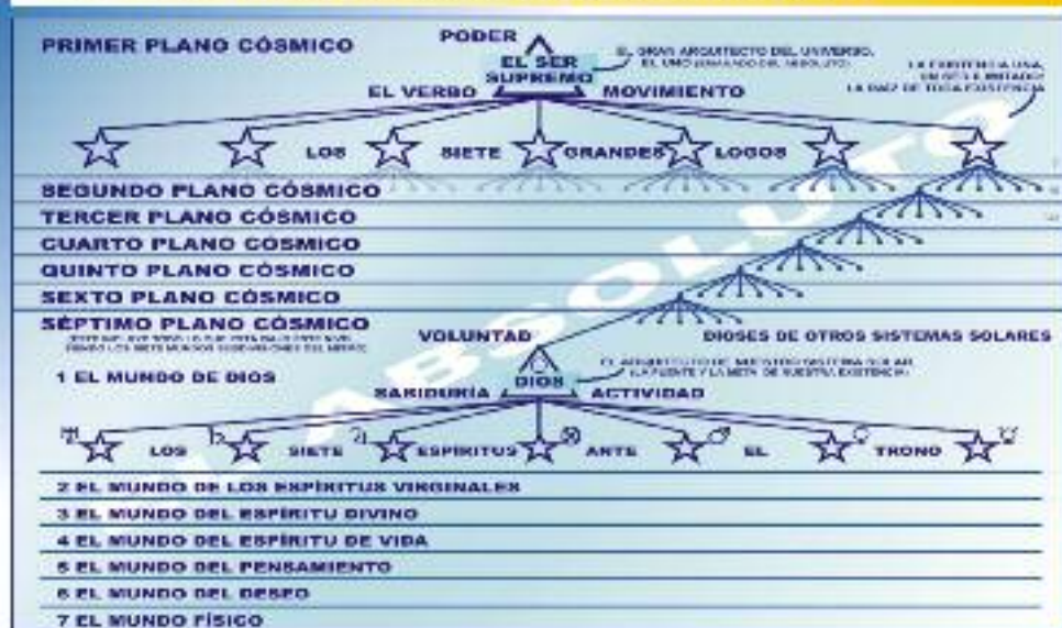
Ilustración n° 4